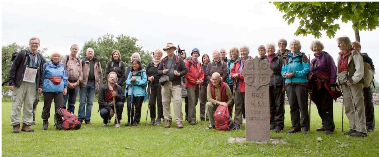
(Starten av Langvandringen 2011, ved milesteinen i Middelalderparken i Gamlebyen i Oslo.)

Annonsering i regi av Pilegrimssenter Oslo skjedde i avisen Vårt Land, de øvrige regionale sentrene annonserte i regionale aviser i sine regioner.