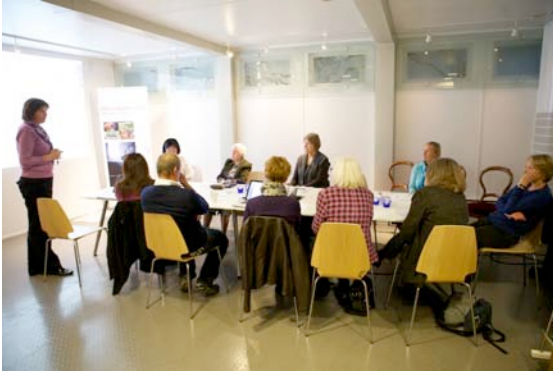
Møte i Pilegrimsfellesskapet St.Hallvard

gjennomført. Videre er det samarbeid med Groruddalen historielag og Pilegrimsledens venner som begge arrangerer vandringer langs leden i sine områder. Særlig viktig er her det arbeidet Pilegrimsledens venner gjør mht den kulturelle skolesekk i Bærum hvor om lag 1500 elever vandrer langs leden hvert år. Gjennom høsten 2011 har Pilegrimssenter Oslo i samarbeid med Østre Aker prosti og Fortellerhuset om utvikling av søknad til Oslo kommune om å etablere Kulturell skolesekk knyttet til tema pilegrim og pilegrimsleden for elever i Groruddalen. Senterleder har også hatt vandring med studenter.