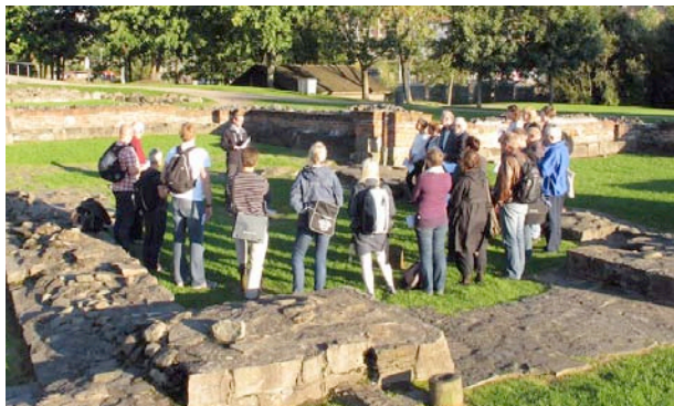
Gruppe studenter samlet i Mariakirken i Middelalderparken, før det er felles vandring langs leden til Gamle Aker kirke hvor det er foredrag

Pilegrimssenter Oslo har også som målsetning å imøtekomme ønsker om lokale pilegrimsvandringer og –arrangement i menigheter, foreninger, klubber og lag i regionen.