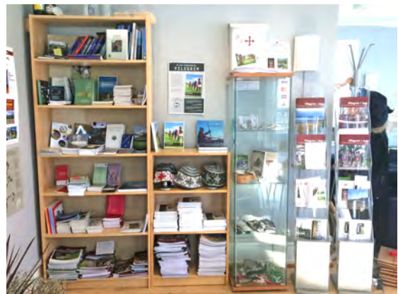
(Litteratur, merker med mere for salg.)

Alle de regionale pilegrimssentrene har egne hjemmesider. RPS Oslo har en godt utbygd hjemmeside som speiler en bred og omfattende virksomhet: www.oslo.pilegrimsleden.no