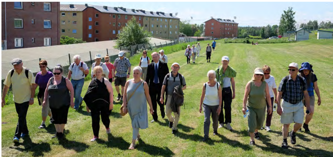
(Sesongåpning – på vei mot Østre Aker kirke)

Sesongåpningen ble gjennomført på en vellykket måte i Oslo-regionen. Alle etapper var dekket, noen etapper ble dekket dagene i forveien, om lag 50-60 personer deltok. Det var ett større arrangement for dagen, med pilegrimsgudstjeneste i Oslo domkirke (150 deltakere) med senterleder som dagens predikant og påfølgende vandring (35 deltakere) til Østre Aker kirke, hvor et 50-talls personer ventet og det var grilling av "Pilegrimens urtepølse" i regi av FK Akershus, hilsninger, kunstutstilling og konsert med Olavs-musikk. Med på arrangementet var statssekretær i Miljødep., og representant for RA.