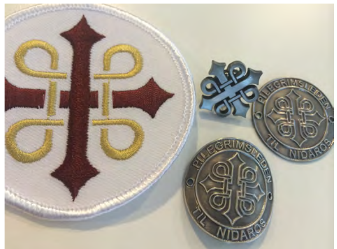
(Promoteringsmateriell produsert 2014)

RPS Oslo bidrar til å promotere pilegrim som reiselivsprodukt på flere måter. Ved å legge til rette for pressetur (årets pressetur som skulle finne sted nå i høst med WikingerReisen ble avlyst). Videre gjennom arbeid mot turoperatører, se pkt d) ovenfor, og kontakt mot tilbydere. RPS Oslo står også etter tillatelse fra NPS, for produksjon av promoteringsmateriell for derigjennom å synliggjøre pilegrim på materielt vis gjennom identitetsskapende merker. Endelig gjennom å spre forskningsbasert kunnskap om pilegrim i dag som har relevans for å forstå målgruppen "pilegrim", for derigjennom bedre å kunne målrette tilbud og aktiviteter.