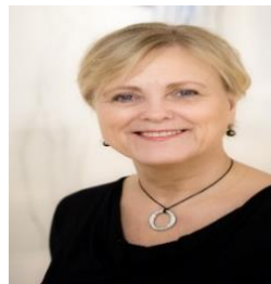
Tidligere kulturminister, Torhild Widvey